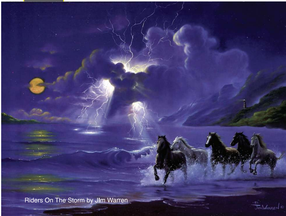
Riders On The Storm by Jlm Warren