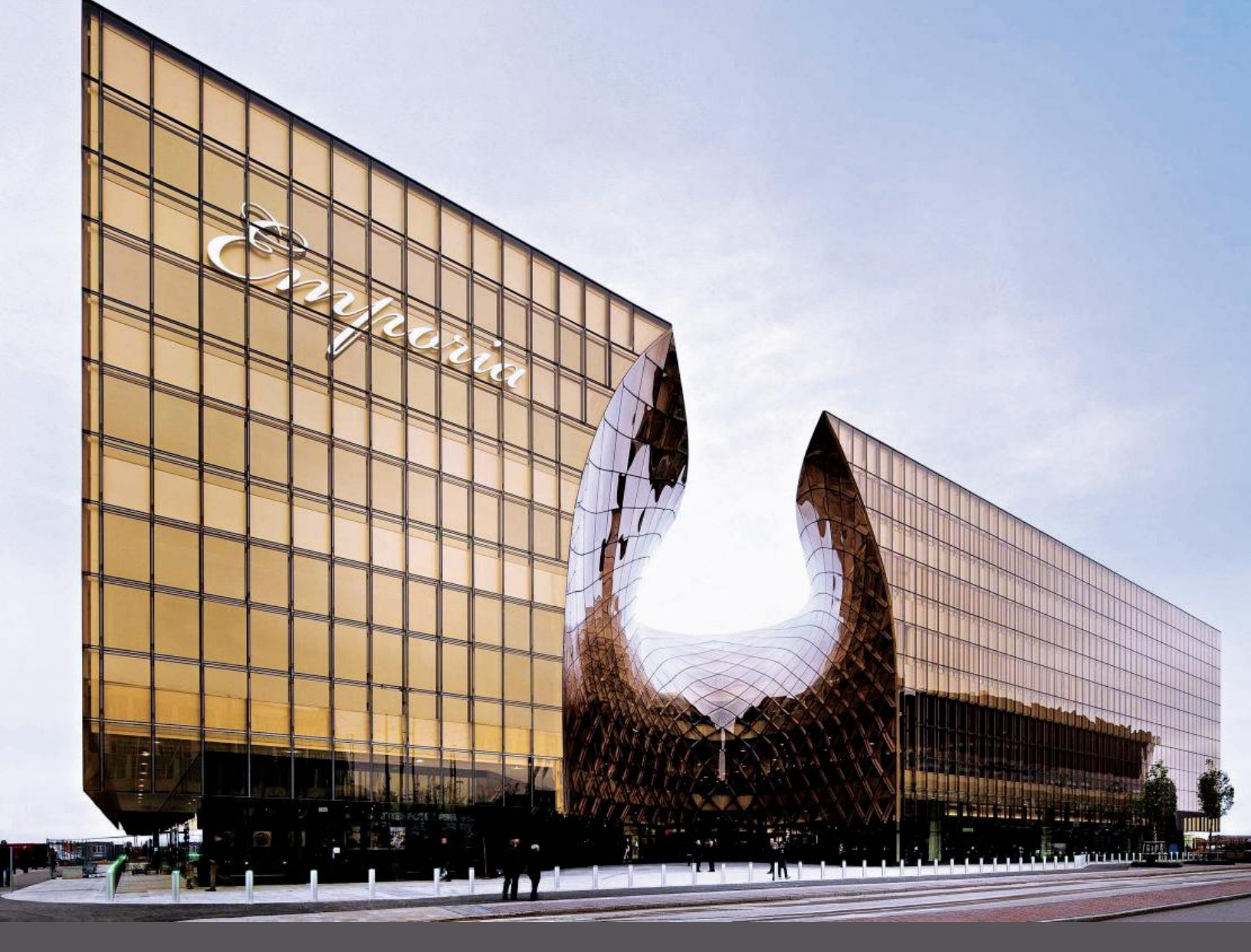
Above: Emporia Shopping Centre, Malmö, Sweden, 2013.

The focus is on what is absent, which gives the present its unique meaning. Gert Wingårdh arkitektkontor.